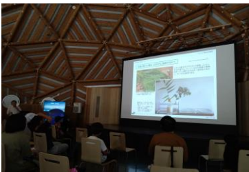
■ 13. 講演-⑦ (幼虫を採った時の育て方は…、)