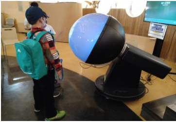
■ 4. これなに?-② (地球儀?)