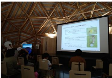
■ 10. 講演-④ (虫の見つけ方、採り方、そしてその長所、短所です…)