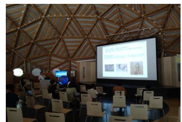
■ 18. 講演-⑫ (冬眠や夏眠=休眠、卵や蛹が冬前に発生停止する休眠…?)