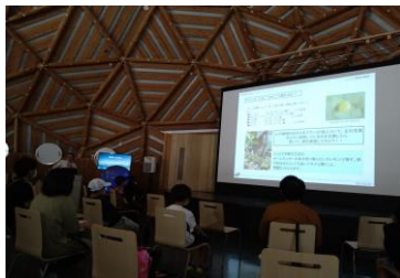
■ 11. 講演-⑤ (アゲハの“たまご”はどこで採れるか…、)