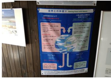
■ 2. 会場前-② (入口そばの環境体験館の基本コンセプト?)