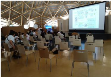
■ 7. 講演-① (山本さんのお話しが始まりました。今日のテーマは…)