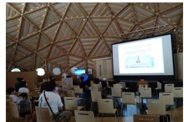
■ 15. 講演-⑨ (環境体験館や周辺地域の小学校にプレゼントしたそうです。)