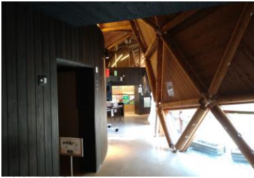
■ 1. 会場前-① (今日はシアター会場です。中庭の吹抜けがいいですね。)