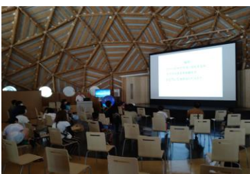
■ 16. 講演-⑩ (アゲハのサナギは、羽化する、越冬するをどうして決める…?)