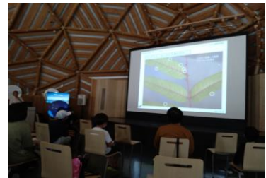
■ 12. 講演-⑥ (こんな葉っぱの裏(表)にもついているようです。)