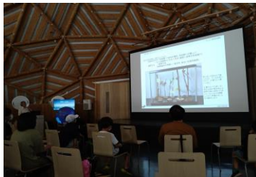
■ 14. 講演-⑧ (採った幼虫を越冬させる方法は…、)