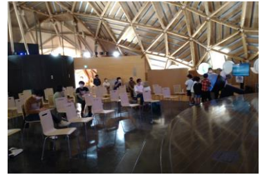
■ 3. 会場 (ゆったりとした空間です。)