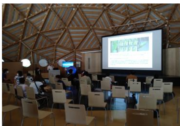
■ 17. 講演-⑪ (アゲハのサナギは、春になり昼の時間が長くなると羽化する…)