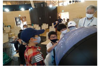
■ 6. これなに?-④ (副館長さん、これはね…触れる地球なんだよ、)